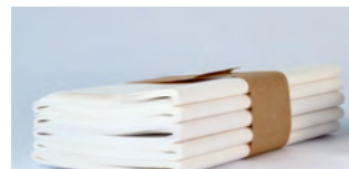
Beispiel für Produktstapel aus der delta-pro