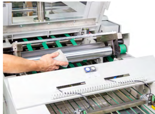
Leicht zugängliche Presstation der delta-pro