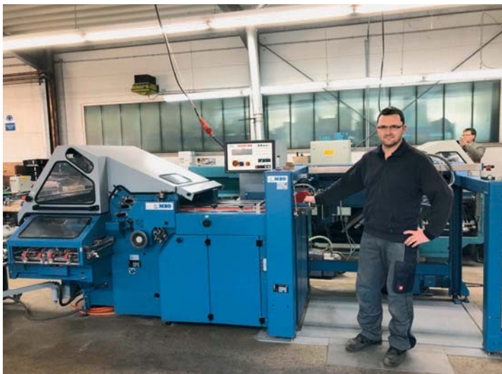
Baujahr 2002 – und heute fast wie neu: Bei der Schirk Medien GmbH läuft die MBO K 76 nach dem Steuber »reFit« äußerst zuverlässig.

Gute Gebrauchtmachines sind begehrt. Umso mehr gilt das, wenn sie das »reFit«-Siegel der Heinrich Steuber GmbH+Co. tragen. Mit dem Label signalisiert das Mönchengladbacher Systemhaus, dass an einer Ma-