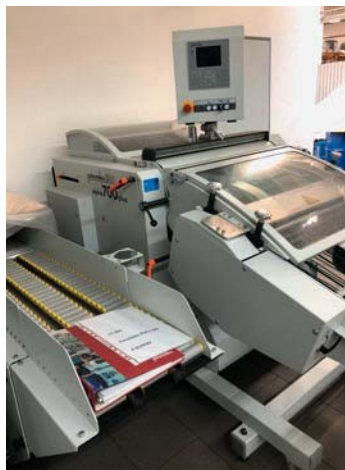
Von Steuber wieder in einen Top-Zustand gebracht: die palamides-Stapelauslage alpha 700 »reFit«.